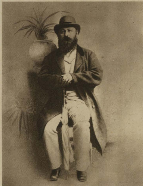
Anzengruber 1878. Nach einer Schnellphotographie