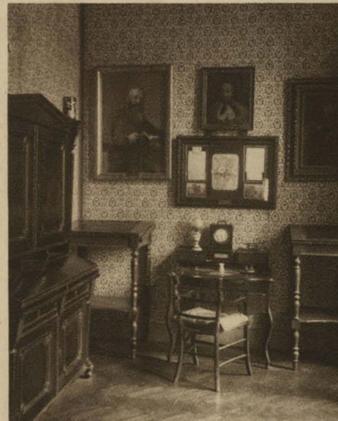
Anzengruber-Zimmer im Historischen Museum der Stadt Wien