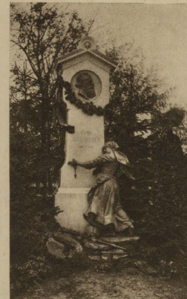
Grabdenkmal von Hans Scherge auf dem Zentralfriedhof